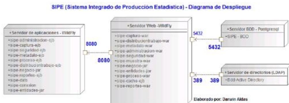
Ilustración 1 Diagrama de despliegue del sistema Integrado de Producción Estadística